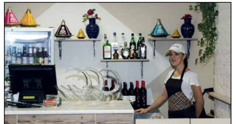
BAR: BIBITE E LIQUORI DELLE MIGLIORI MARCHE - VINO D.O.C.

APERTO da Lunedì a Domenica SOLO SERA 18,30 - 24,00 chiusura cucina ore 23