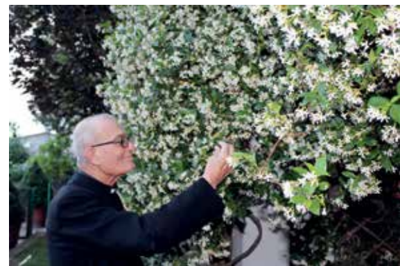
OGNI BRICIOLA È UN FIORE DATO CON AMORE