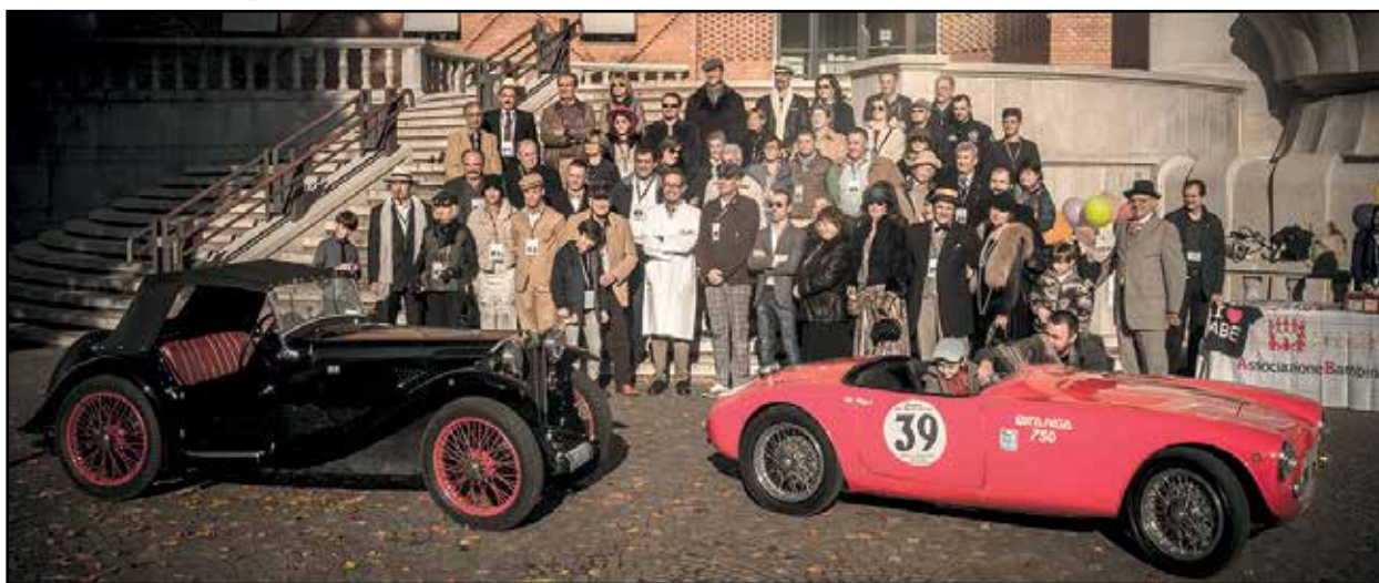
I partecipanti all'evento presso gli Spedali Civili di Brescia.

Brescia Spedali Civili, 8 novembre 2015 organizzazione Cameb