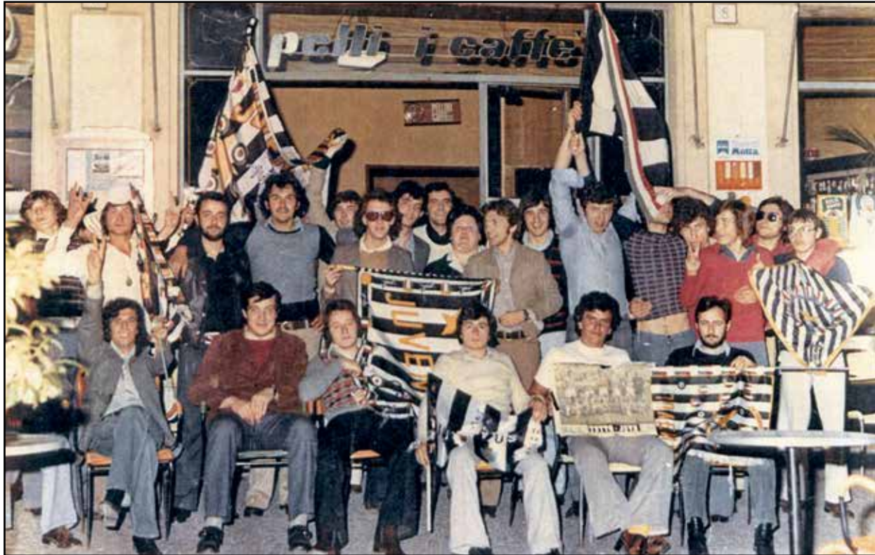
Tifosi juventini davanti allo storico Bar Roma.