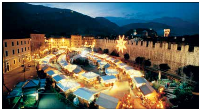
Il suggestivo mercato di Natale.

Dopo il pranzo in un ristorante, trasferimento nel pomeriggio a Rovereto per la degustazione del cioccolato e l'illustrazione della tecnica di produzione dei golosi ed esclusivi prodotti. Successiva visita al mercatino quest'anno denominato "Natale dei Popoli". La partenza alle ore 8 presso l'Hotel faro e rientro